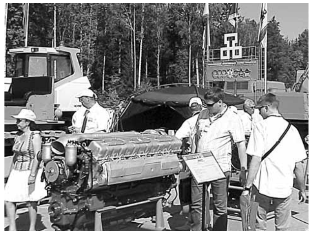
Танковый дизель В-92-С2

Моторную продукцию ЧТЗ представляли новый 1000-сильный танковый дизель В-92-С2, благодаря которому танк Т-90 получил прозвище «летающий», перспективные двигатели серии «Т» двойного (гражданского и специального) назначения — 4Т371 и 6Т370.