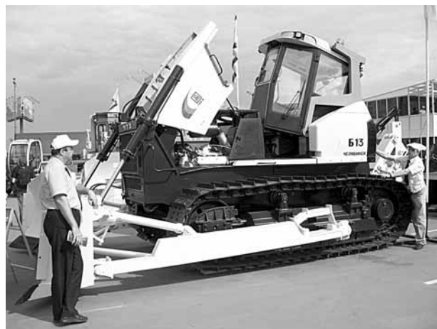
Новый бульдозер ЧТЗ Б-13