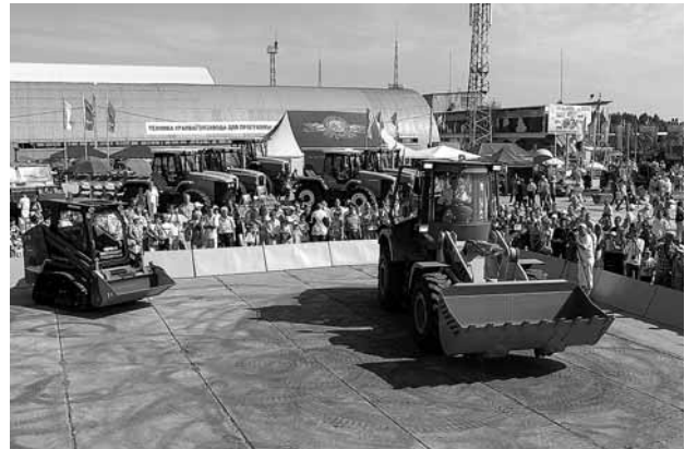
Погрузчики ЧТЗ «Proffi»

ЧТЗ представил в Тагиле все три модели колесных погрузчиков «Proffi». На общей демонстрационной площадке дважды в день устраивались шоу-показы техники, где традиционно блистали колесные погрузчики ЧТЗ.