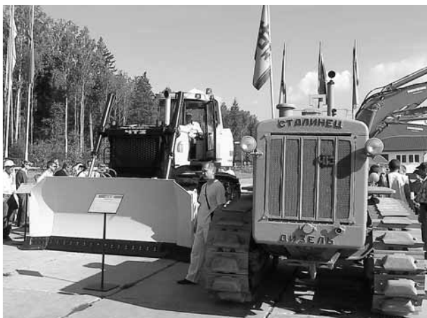
Символы развития ЧТЗ

приобрести эту технику высказывали представители МЧС, руководители добывающих карьеров и строители.