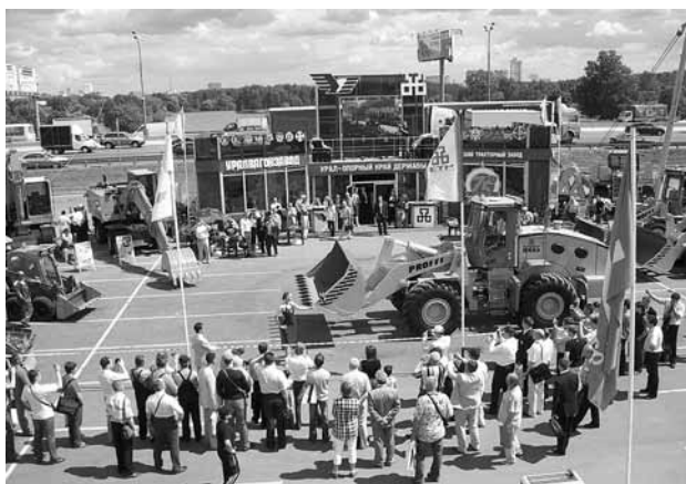
Экспозиция ЧТЗ на СТТ–2008

«ЧТЗ-Уралтрак» стал одним из самых заметных участников крупнейшей в стране международной выставки инженерных машин «Строительная техника и технологии–2008», которая проходила с 17 по 21 июня 2008 г. в столичном «Крокус-экспо».